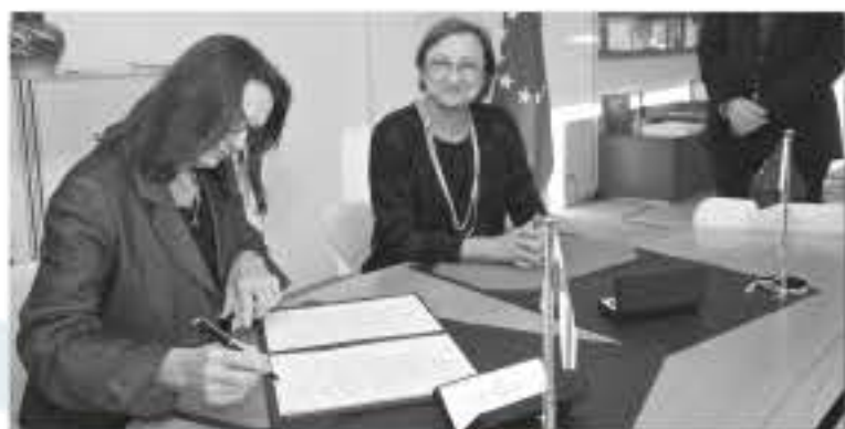
Deposit of the instrument of ratification of Protocol No. 16 / Dépot de l'instrument de ratification du Protocole n° 16 (07/12/2015)