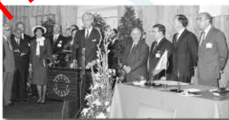
Accession to the Council of Europe / Adhésion au Conseil de l'Europe (05/05/1989)