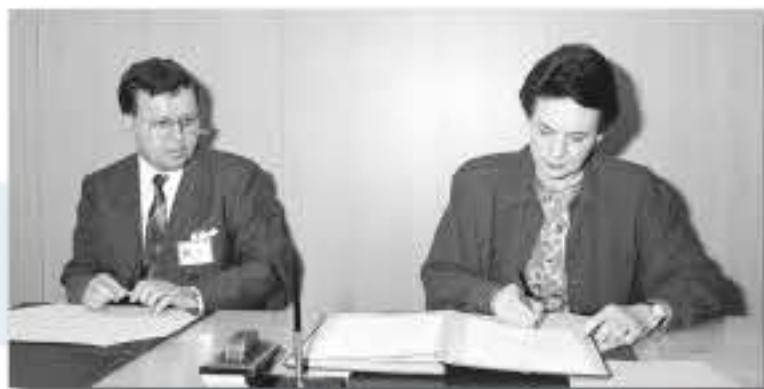
Deposit of the instrument of ratification of the Convention / Dépot de l'instrument de ratification de la Convention (10/05/1990)